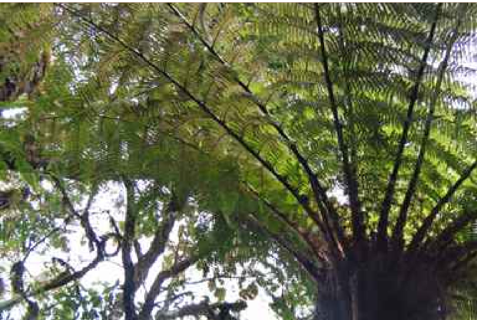
Helechos gigantes, La Yunga Mairana