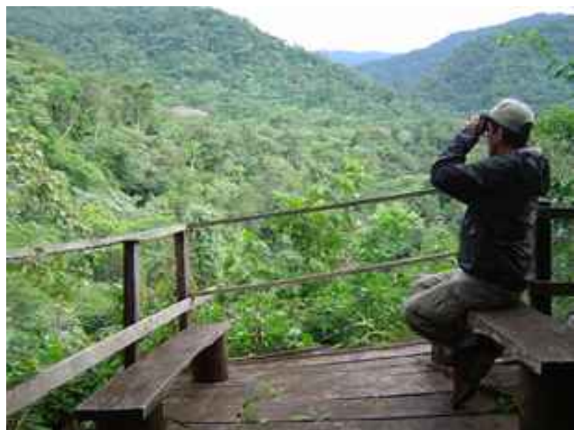
La Yunga, Mairana

El Programa Parques en Peligro se inició el año 1990, como una iniciativa de emergencia para proteger estas áreas y conservar los ecosistemas y comunidades naturales, así como a las especies en peligro contenidas en éstos. En nuestro país, son varias las áreas protegidas que han contado con el apoyo de este programa, entre las que se encuentra el Área Natural de Manejo Integrado y Parque Nacional Amboró. En esta área, el PeP tuvo tres fases multianuales, discontinuas, implementadas por la Fundación Amigos de la Naturaleza, siendo la última fase el objeto de la presente memoria.