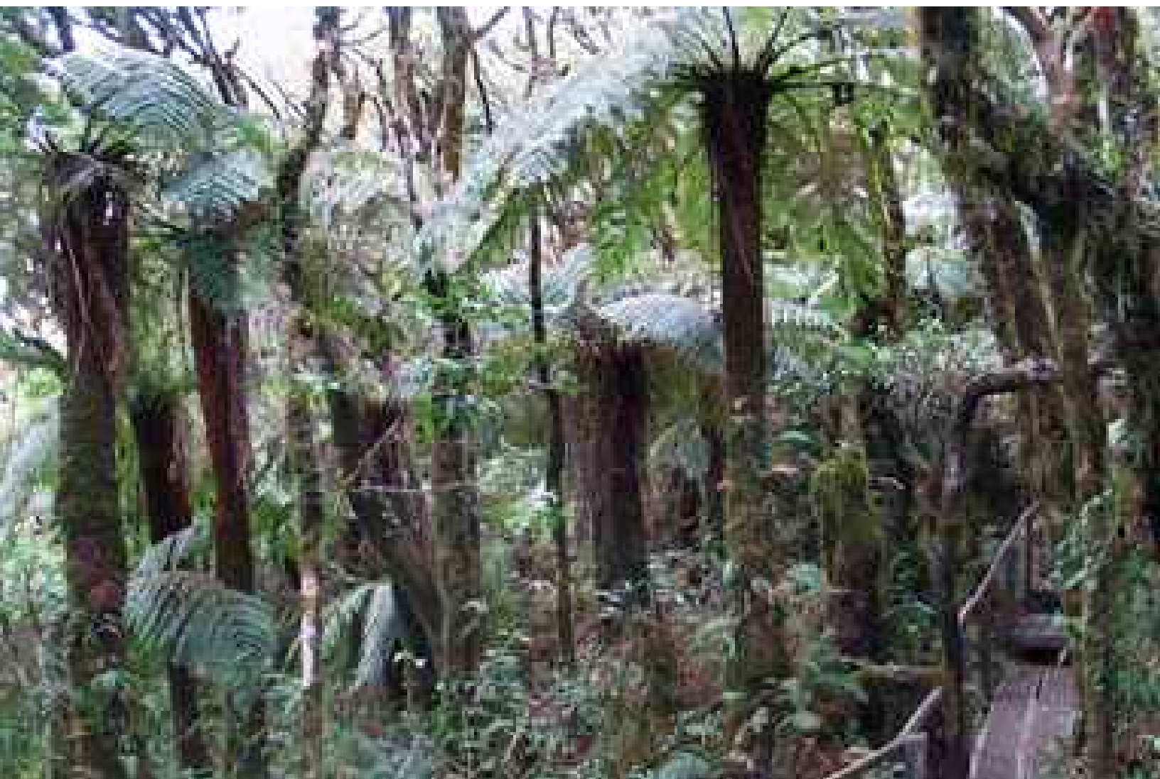
Sendero del Sitio Ecoturístico Los Helechos Gigantes en La Yunga Mairana