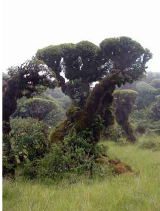
El Piritial, Cabracancho - Comarapa