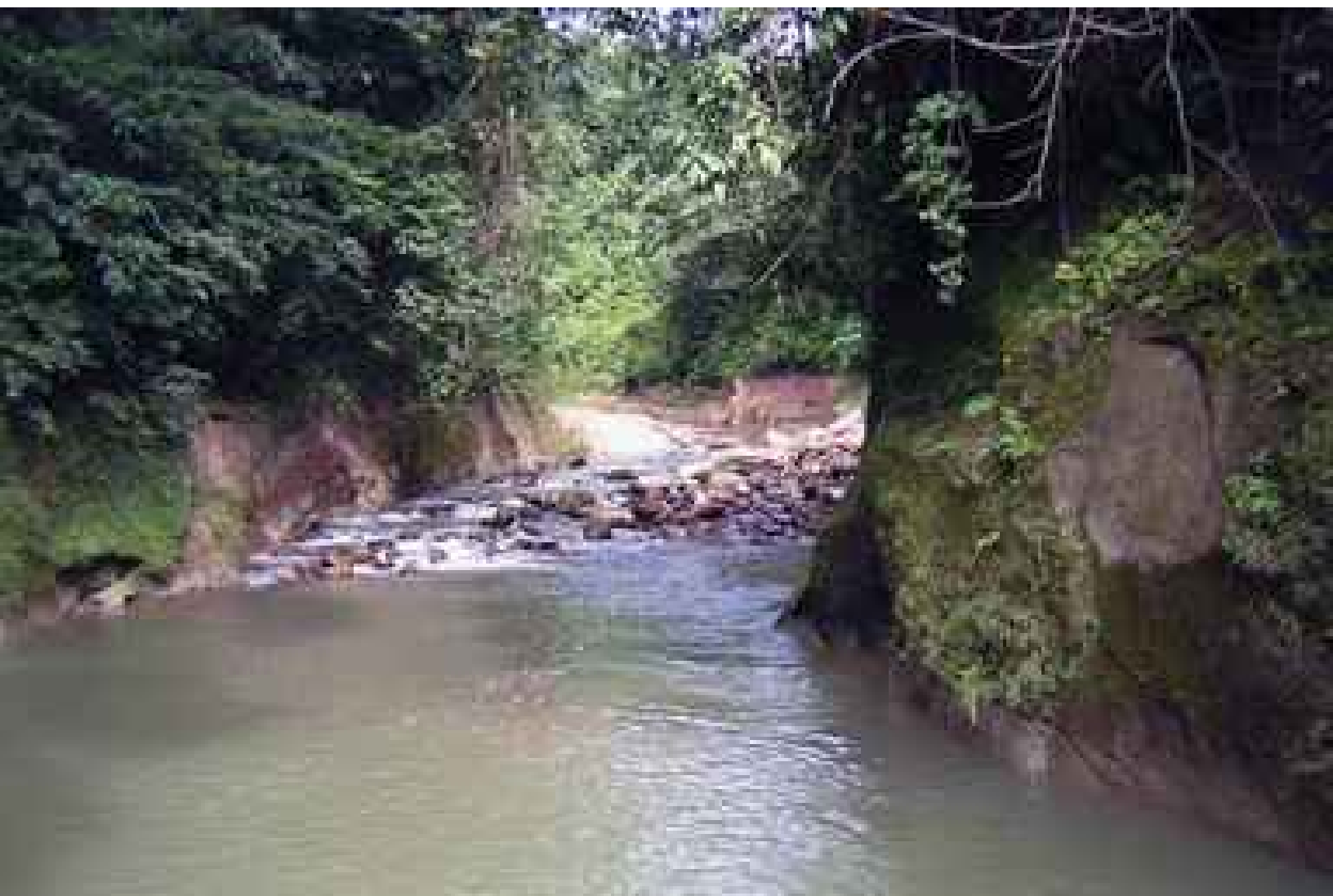
Sendero del sitio Ecoturístico La Chonta.