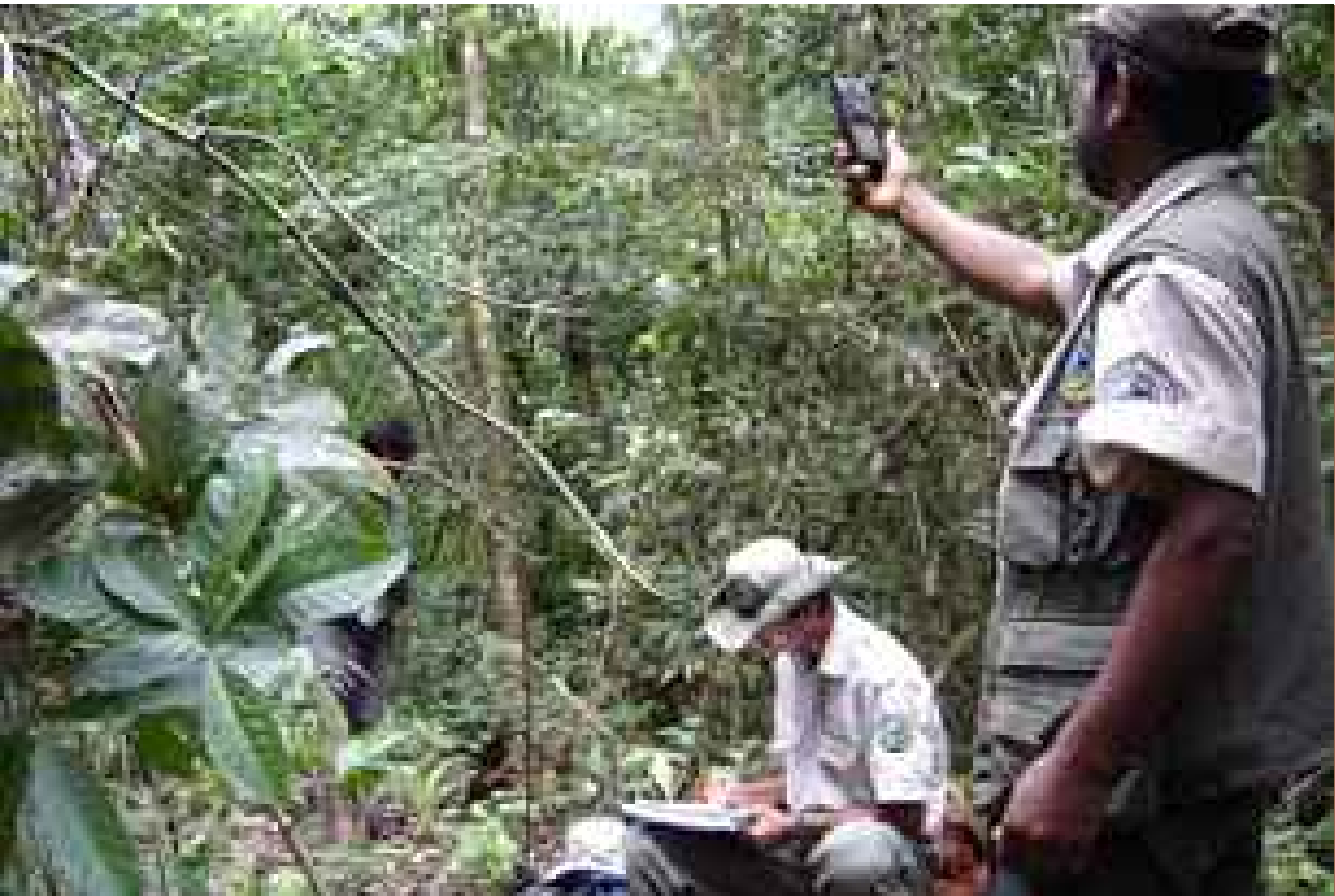
Guardaparques del Área Protegida Amboró