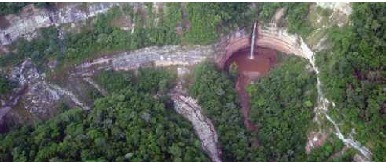
Caída de los Tumbos en El Jardín de las Delicias, El Torno