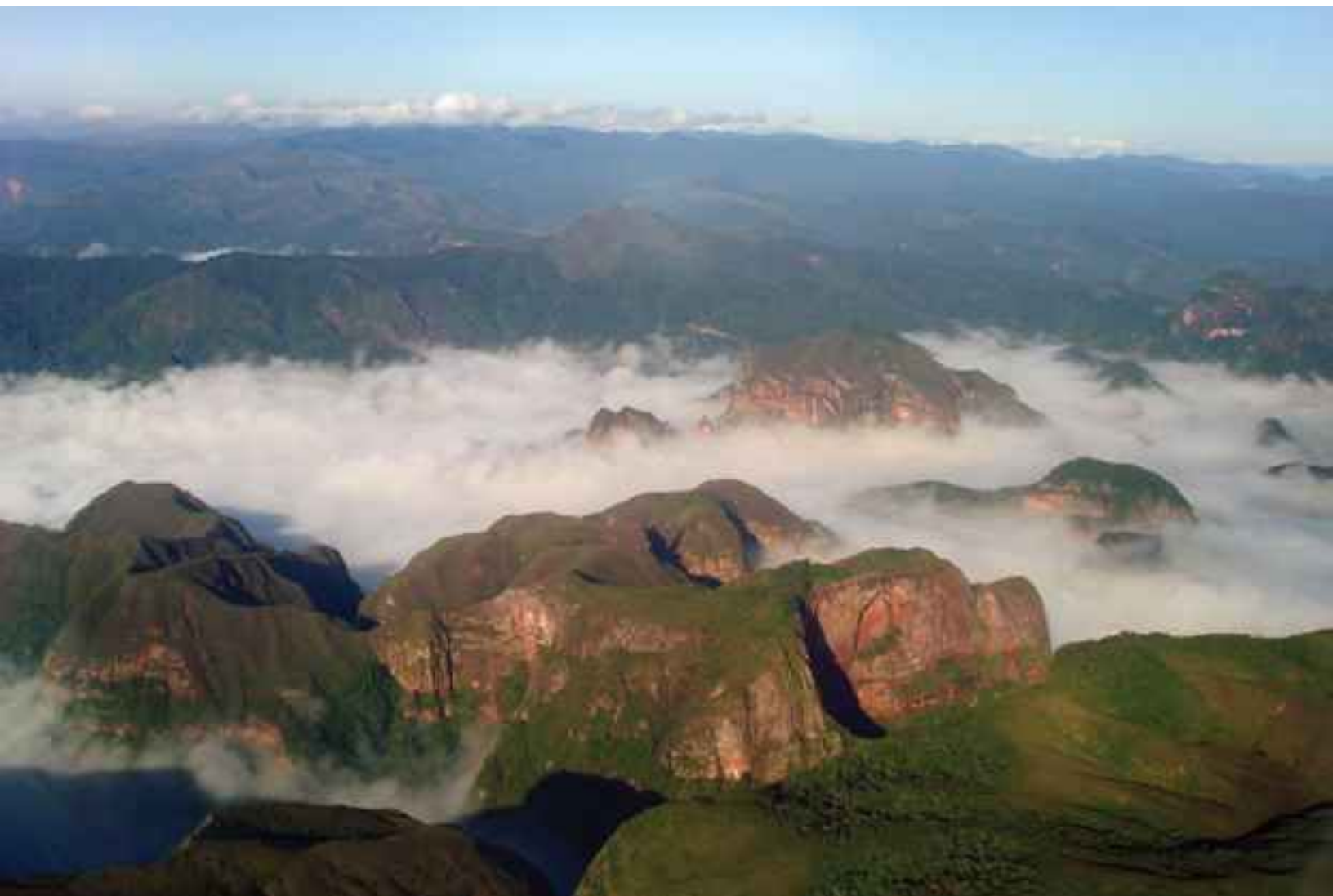
Serranía de Volcanes, en la zona sur del Amboró