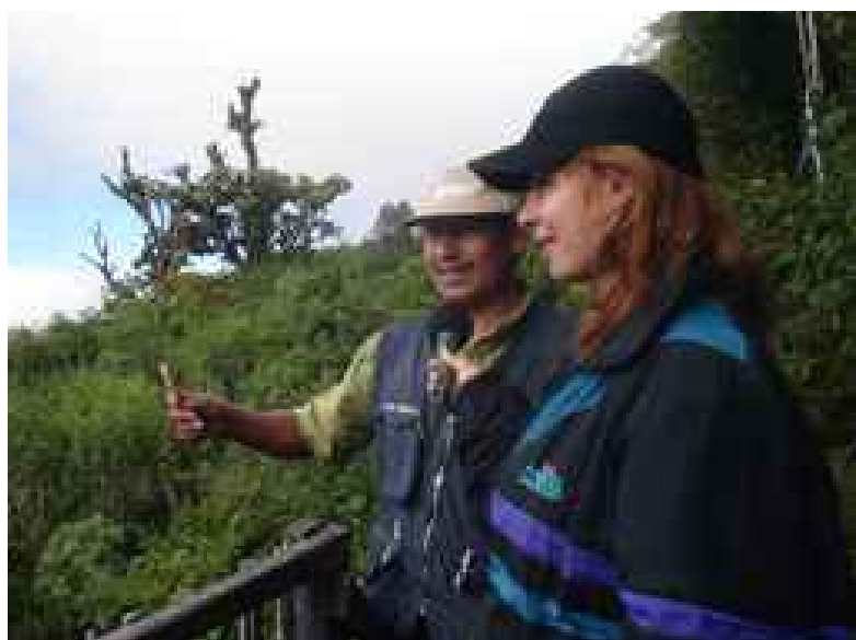
El Mirador, La Yunga Mairana