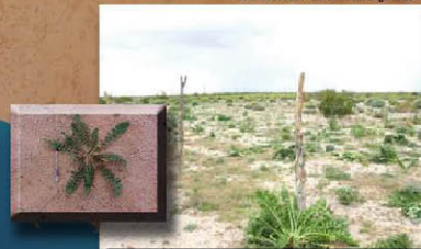
Mostaza o mostazilla