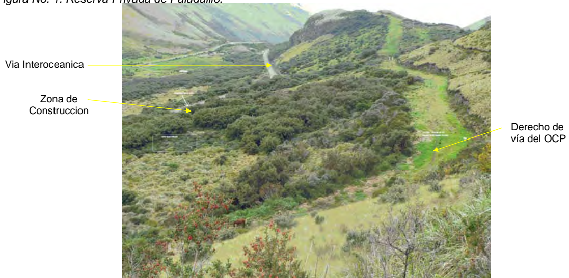
Figura No. 1. Reserva Privada de Paluguillo.