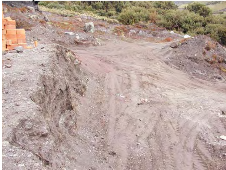
Figura No. 7 Zona de revegetación inmediata.

Se deberá contar con tres recipientes de 50 gls. De capacidad con sus respectivos letreros que indiquen su contenido. Los desechos se clasificarán en plásticos y vidrios como una categoría, desechos orgánicos y todo lo concerniente a aceites y grasas (como filtros o tarros de aceites). Materiales como metales, madera y papel serán reciclados y transportados hacia los sitios específicos para su reciclaje. El material generado en baños y cocina será almacenado en fundas plásticas negras para basura y transportadas hacia el Relleno Sanitario establecido por el Distrito Metropolitano de Quito.