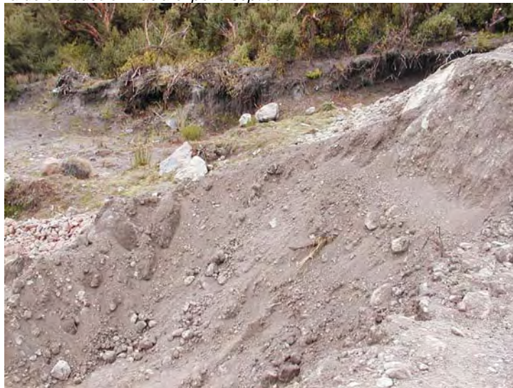
Figura No. 5. Zona de conducción hacia el pozo séptico.

Los desechos líquidos serán tratados de forma separada para eliminar mediante tratamiento químico el agua procedente de los lavabos, duchas y lavandería y con tratamiento biológico el agua procedente de las baterías sanitarias y la cocina. El tratamiento químico deberá contar con un floculante de aluminio que se tratará mediante dosis semanales en un tanque plástico separado que permita recolectar los flóculos finales, estos serán secados y depositados en fundas plásticas para ser transportados hacia los rellenos sanitarios establecidos en el Distrito Metropolitano de Quito. El sistema para tratamiento biológico será de tipo anaerobio y se realizará en un tanque séptico horizontal de color negro. Para generar la eliminación de gases anaerobios se instalará un aireador o blower para generar el movimiento de las bacterias. Los sólidos decantados en el fondo del tanque deberán ser eliminados y podrán tener la misma disposición que los sólidos producidos por la floculación. Finalmente el agua que sale del tanque deberá ser analizada para establecer la cantidad de bacterias presentes y luego conducida hacia el pozo séptico establecido en la parte baja de la construcción.