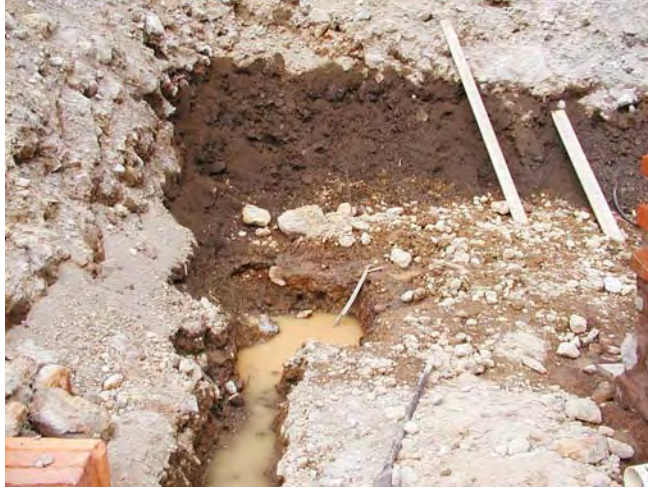
Figura No. 4 Presencia de afloramientos de agua.