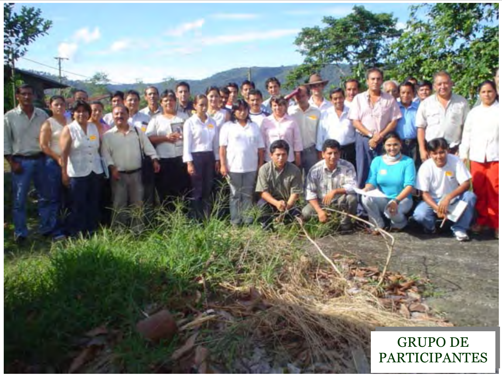
GRUPO DE PARTICIPANTES